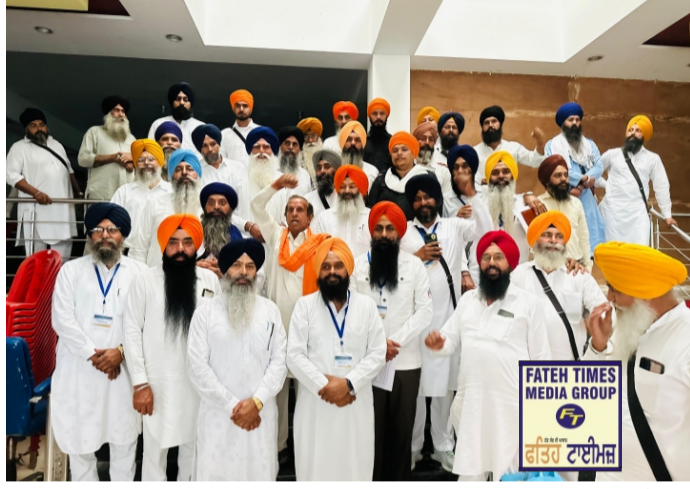
ਕਮੇਟੀ, ਸਮੂਹ ਨਿਯੁਕਤ ਕੀਤੇ ਜਿਲਾ ਭਰਪੂਰ ਹਾਜ਼ਰੀ ਲਗਵਾਈ। ਮੀਟਿੰਗ ਦੌਰਾਨ ਪ੍ਰਧਾਨ, ਹਲਕਾ ਇੰਚਾਰਜ ਅਤੇ ਐਗਜ਼ੀਕਿਊਟਿਵ ਕਮੇਟੀ ਦੇ ਮੈਂਬਰਾਂ ਨੇ