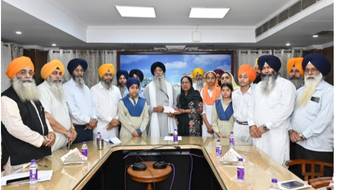
ਸ਼੍ਰੋਮਣੀ ਕਮੇਟੀ ਸਿੱਖੀ ਦੇ ਪ੍ਰਚਾਰ ਪ੍ਰਸਾਰ ਲਈ ਹਮੇਸ਼ਾ ਕਾਰਜਸ਼ੀਲ ਰਹੀ ਹੈ। ਜਿਥੇ ਦੇਸ਼ ਭਰ ਅੰਦਰ ਗੁਰਮਤਿ ਸਮਾਗਮਾਂ ਰਾਹੀਂ ਸਿੱਖੀ ਪ੍ਰਚਾਰ ਕੀਤਾ ਜਾਂਦਾ ਹੈ, ਉਥੇ ਹੀ ਧਰਮ ਪ੍ਰਚਾਰ ਕਮੇਟੀ ਵੱਲੋਂ ਸ਼੍ਰੋਮਣੀ ਕਮੇਟੀ ਦੇ ਪ੍ਰਬੰਧ ਹੇਠ ਚੱਲ ਰਹੇ ਵਿਦਿਅਕ ਅਦਾਰਿਆਂ ਦੇ ਅੰਮ੍ਰਿਤਧਾਰੀ ਵਿਦਿਆਰਥੀਆਂ ਲਈ ਵਜੀਫਾ ਰਾਸ਼ੀ ਦੀ ਯੋਜਨਾ ਵੀ ਚਲਾਈ ਜਾ ਰਹੀ ਹੈ। ਇਸ ਤਹਿਤ ਹਰ ਸਾਲ ਅੰਮ੍ਰਿਤਧਾਰੀ ਵਿਦਿਆਰਥੀਆਂ ਨੂੰ ਉਨ੍ਹਾਂ ਦੀਆਂ ਫੀਸਾਂ ਲਈ ਕਰੋੜਾਂ ਰੁਪਏ ਵਜੀਫੇ ਵਜੋਂ ਦਿੱਤੇ ਜਾਂਦੇ ਹਨ। ਇਸ ਵਾਰ 3743 ਅੰਮ੍ਰਿਤਧਾਰੀ ਵਿਦਿਆਰਥੀਆਂ (ਬਾਕੀ ਸਫਾ 2 ਤੇ)